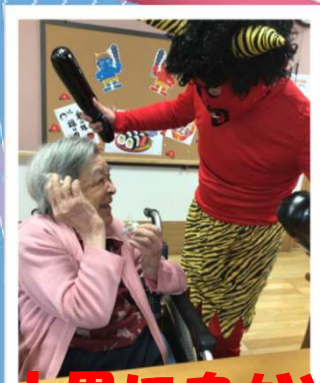
十思に鬼がやってきました!