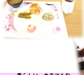
春らしい、カラフルなプレートごはんでお祝いました