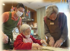
鬼退治の後は、皆で作った恵方巻で福の到来を祈念しました