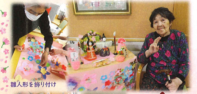
雛人形を飾り付け