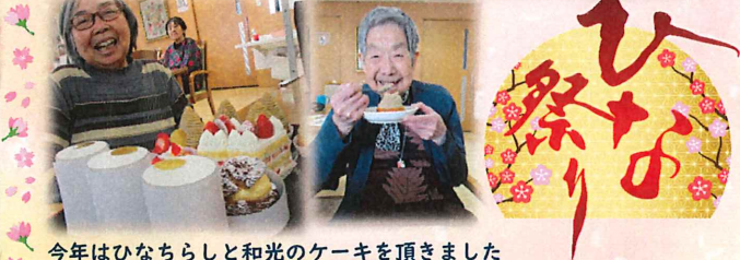
今年はひなちらしと和光のケーキを頂きました