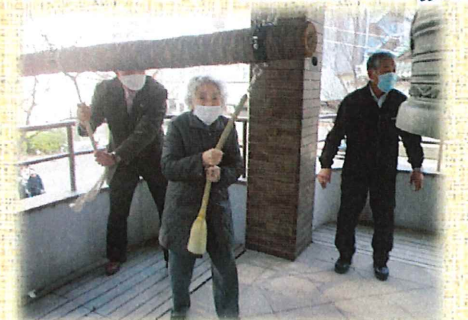
東日本大震災があった3/11に町会の方たちと被災された方のご冥福をお祈りし鐘を撞きました そして、世界に平和が戻りますように・・・