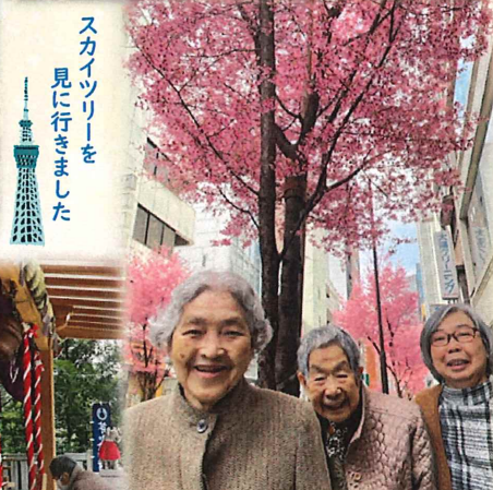
スカイツリーを見に行きました