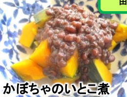
かぼちゃのいとこ煮