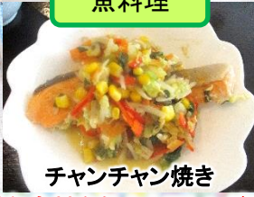
チャンチャン焼き