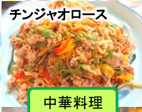
チンジャオロース