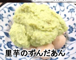
里芋のずんだあん