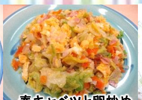
春キャベツと卵炒め