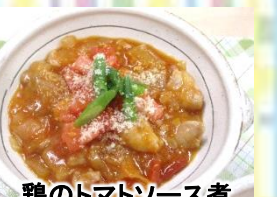
鶏のトマトソース煮